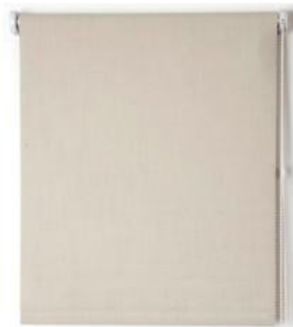
Modelo presente nos prédios do Ministério Público Estadual

Cortina tipo rolô, com sistema de recolhimento vertical (abertura de baixo para cima).