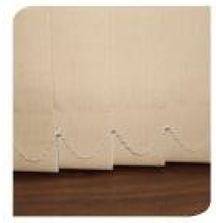
Detalhe dos acabamentos